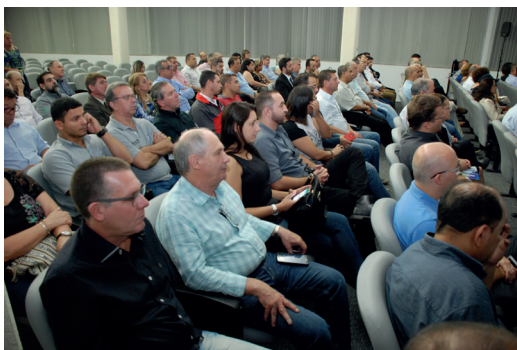
Palestras para empresários e executivos do transporte e parceiros do SETRANS